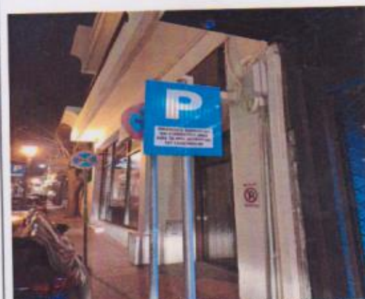
Παράδειγμα προτεινόμενης αντιμετώπισης του θέματος από άλλο δήμο της χώρας