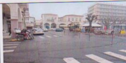
Η παρούσα κατάσταση στην πλατεία